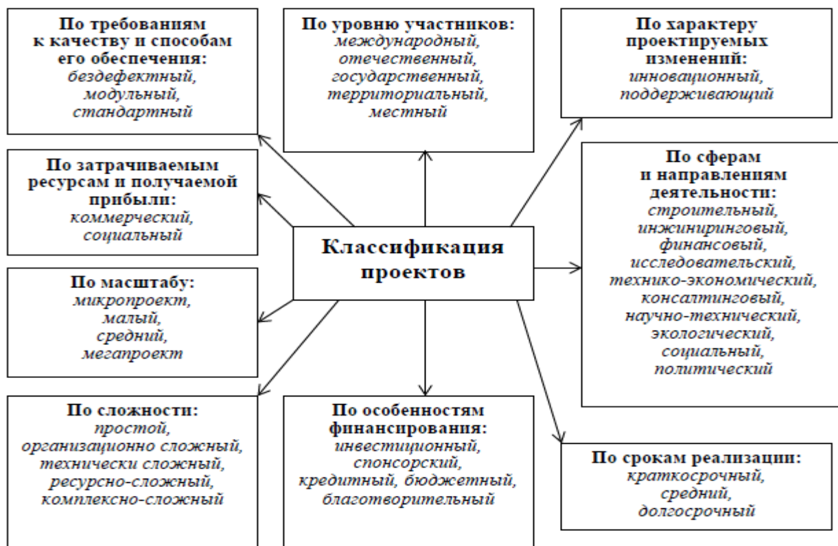
Рисунок 1 – Классификация проектов

Этот термин имеет техническое звучание, но в настоящее время он также используется для обозначения интеллектуальной деятельности по созданию проектов самых разнообразных типов.