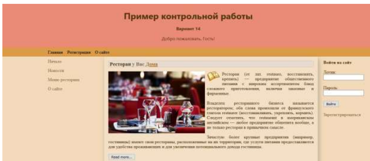
Рисунок 4 – Результат создания сайта ресторана