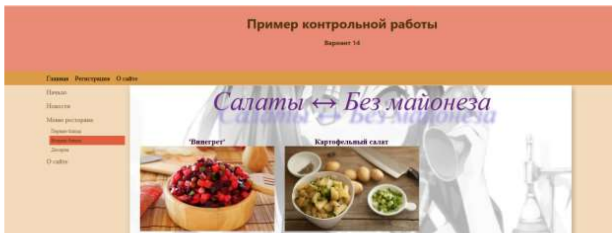
Рисунок 3 – Результат создания сайта ресторана