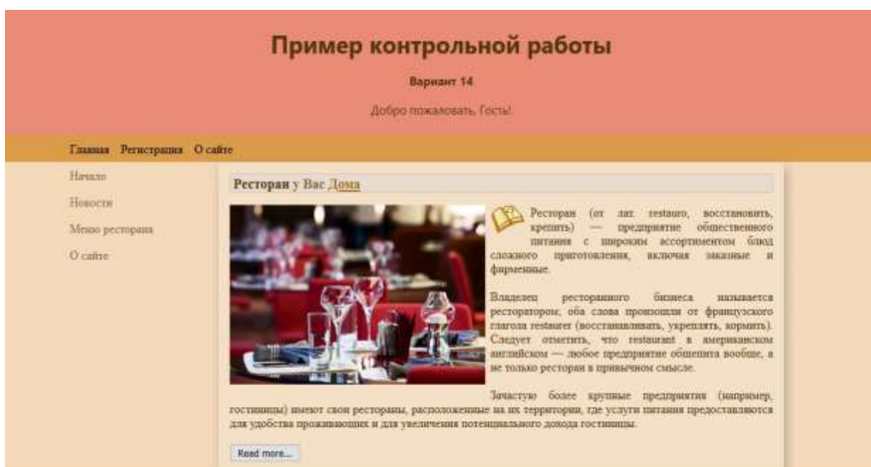
Рисунок 1 – Результат создания сайта ресторана

В результате выполнения задания были получены результаты, приведенные на рисунках 1-5.