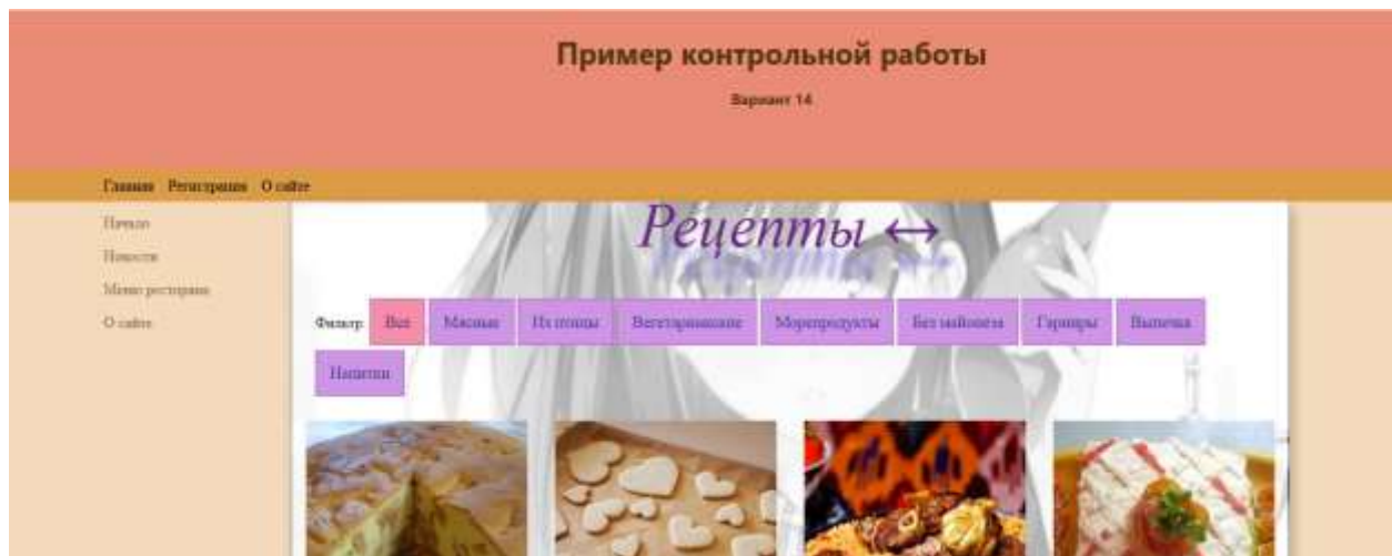
Рисунок 5 – Результат создания сайта ресторана