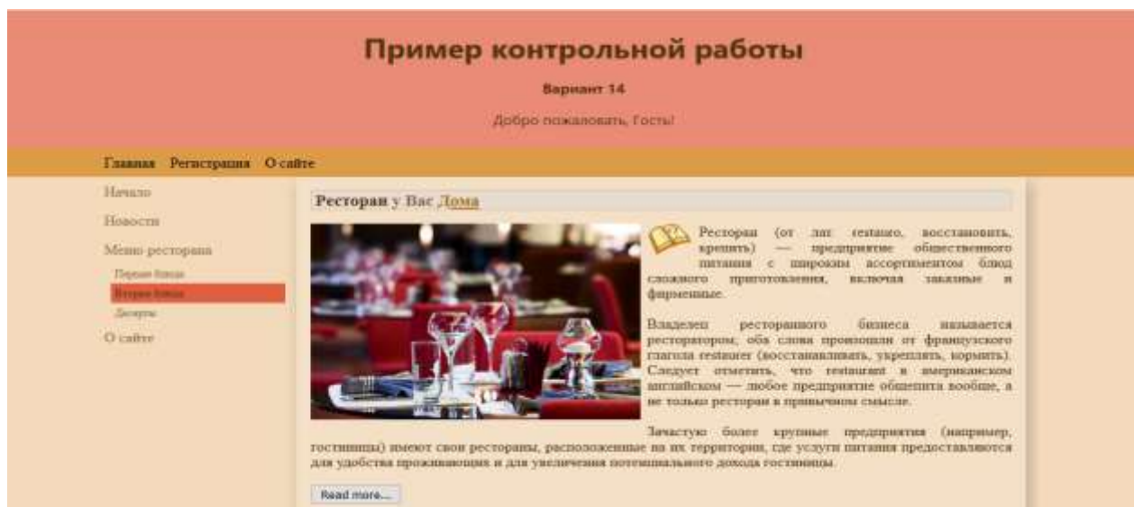
Рисунок 2 – Результат создания сайта ресторана